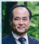
コーディネーター