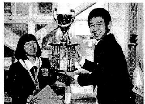
【満面の笑み 空手世界大会入賞！！】

年末には、お忙しいところ教育評価アンケートにご協力いただきありがとうございました。今年度、新たに自由記述欄を設けての実施となりましたが、この後、いただきましたご意見から本校の課題を明らかにするとともに解決の手だてについて検討し、「学校関係者評価委員会」にてご意見をいただき、平成28年度の学校評価としたいと存じます。全体の結果につきましては、3月の学校だよりで報告させていただきます。