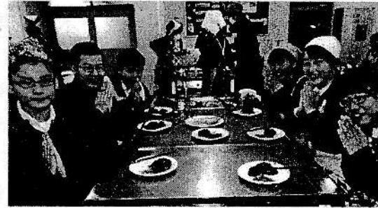
【3年体育、2年書道・調理実習の授業風景】