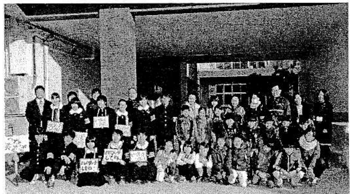
【生徒会あいさつ運動 大宮小学校ピロティにて】