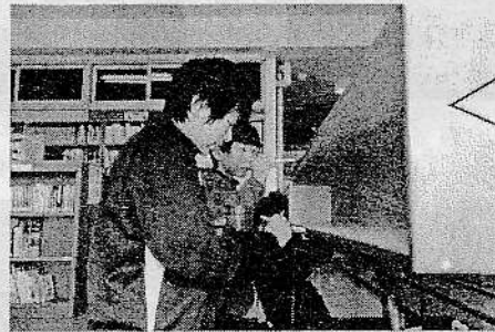
さいたま市サイエンスフェスティバル