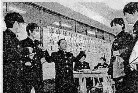
未来くるワークの一コマ