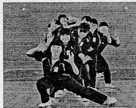
小学校であいさつ運動2月16・17日