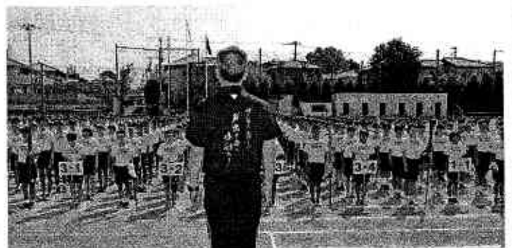
第71回大宮東中学校体育祭開会式

卒業までの3年間、「ハートのある生徒」「ハートのある集団」に成長することを心から願っています。