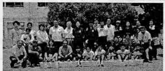
↑上：花壇作り ↓下：プール清掃