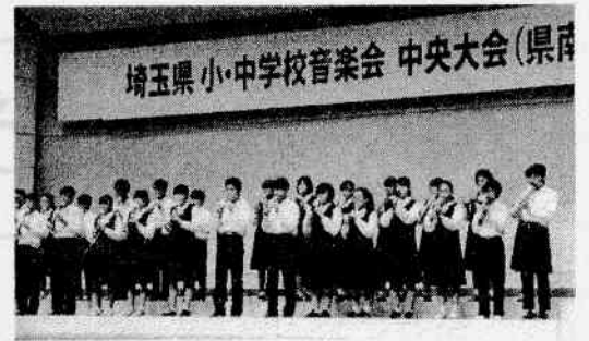
【美しい演奏を披露しました】