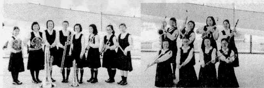
【金管打楽器八重奏銀賞、木管打楽器八重奏銅賞を獲得しました】