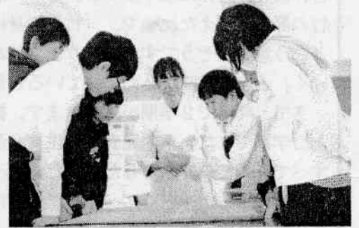
【日本の古典文化を学習しました】