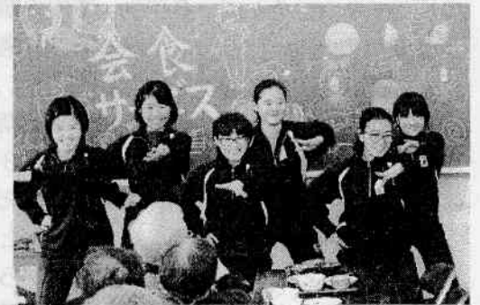
【キレイのよいダンスを披露しました】

学校公開・学年保護者会を実施 12月16日(土) たくさんのご来校 ありがとうございました。