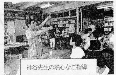
神谷先生の熱心なご指導

この日は「七夕」。東中の若き織姫、彦星たちの作品は、星の如く輝いていました。(学校地域連携コーディネーター 秦野先生)