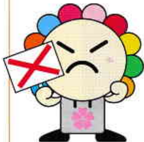
さいたま市選挙キャラクター みらいクワ