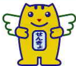
選挙のめいすいくん

全国で約8万人、さいたま市では約1,100人の方が参加している民間の団体です。自主的に参加された方、自治会から推薦された方、学識経験者、青年団体の代表者、女性団体の代表者、報道関係者、教育関係者などが参加し、明るい選挙推進運動を実施しています。