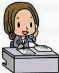
さいたま市消費生活総合センター マスコットキャラクター 相談員さん