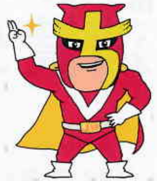
さいたま市消費生活総合センター マスコットキャラクター チヨットマツダマン