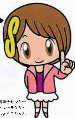
さいたま市消費生活総合センター マスコットキャラクター さいたま しょうこちゃん

消費生活センターでは、商品やサービスの契約トラブルなど、消費生活に関する相談を受け付け、消費生活相談員が相談者の皆さんと共に考え、解決に向けてお手伝いします。