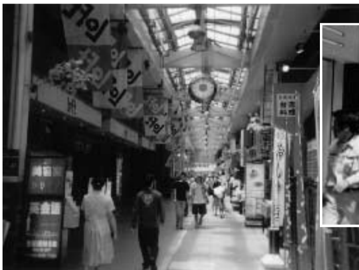
伝統のアーケードを守る一番街

次に、空き地(市所有)の活用ですが、周辺の方々(一番街除く)の駐輪場にしたかどうか?という意見がございますが、私達としては、商店街内に駐輪場が有るのは非常にマイナス・イメージになると思っており、他のことに活用していきたい。したがって、組合員全員の意見を聞き、一番街