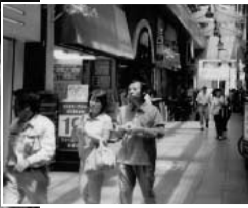
心のサービスをめざします

としての活用を取りまわめていく予定です。又、将来的には、芝浦工大の学生さん達のアイデアも参考にさせて頂きます。